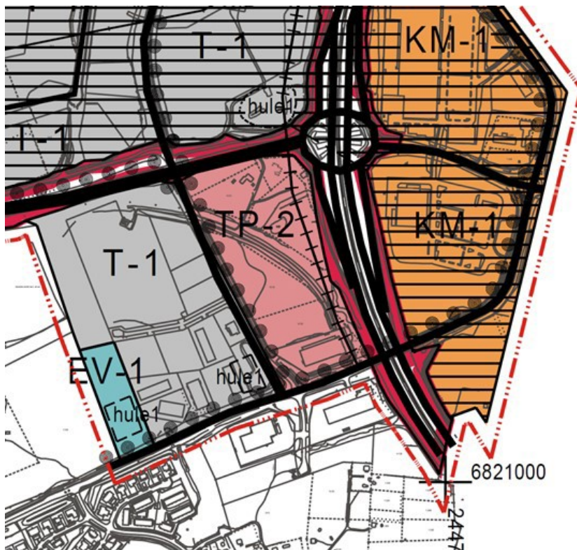
Kuva: Ote keskustaajaman osayleiskaava 2010:stä.

Alueella on voimassa 13.5.2019 hyväksytty Kynnijärvi – Juhansuo osayleiskaavan muutos ja laajennus (Y-18). Alue on merkitty työpaikka-alueeksi (TP-2). Alueelle saa sijoittaa liike- ja toimistotiloja sekä ympäristökuvallisesti näihin verrattavia teollisuus- ja varastotiloja. Teollisuus- ja varastotiloja voidaan rakentaa enintään 50 % rakennetusta kerrosalasta. Alueelle ei saa sijoittaa myyntipinta-alaltaan yli 400 m 2 :n suuruisia päivittäistavarakaupan myymälöitä.