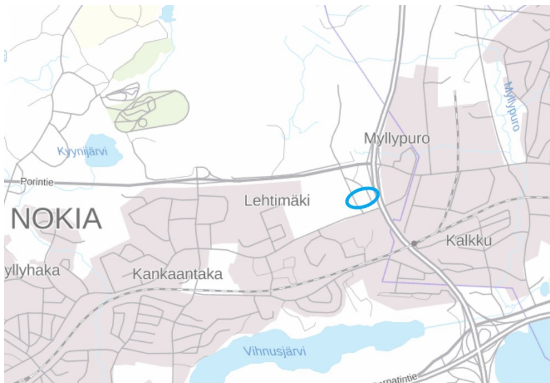
Kaava-alueen sijainti ympäröitynä kartalla (Maanmittauslaitos, taustakartta, 11.6.2020).

Kaava-alue sijaitsee Porintien, valtatie 3:n, Rounionkadun ja Kolmenkulmantien rajaamalla alueella, noin 4 km Pirkkalaistorilta koilliseen.