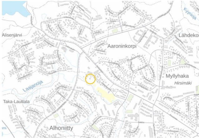
Asemakaavan muutosalueen sijainti opaskartalla

20.3.2020 Dno NOK 207/2019 Maankäyttö- ja rakennuslaki 63§