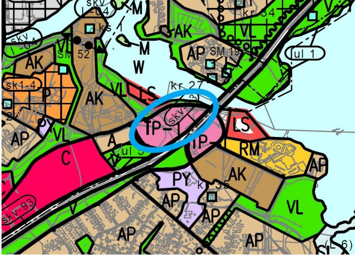
Kuva: Ote keskustaajaman osayleiskaava 2010:stä.

Keskustan osayleiskaavassa 2030, suunnittelualue on osoitettu työpaikka-alueeksi (TP-1), jolle saa sijoittaa liike- ja toimistotiloja sekä ympäristökuvallisesti näihin verrattavia teollisuus- ja varastotiloja. Alueen länsiosaan on merkitty seututie/pääkatu yhteys Nuijamiestentien ja VT12 välille.