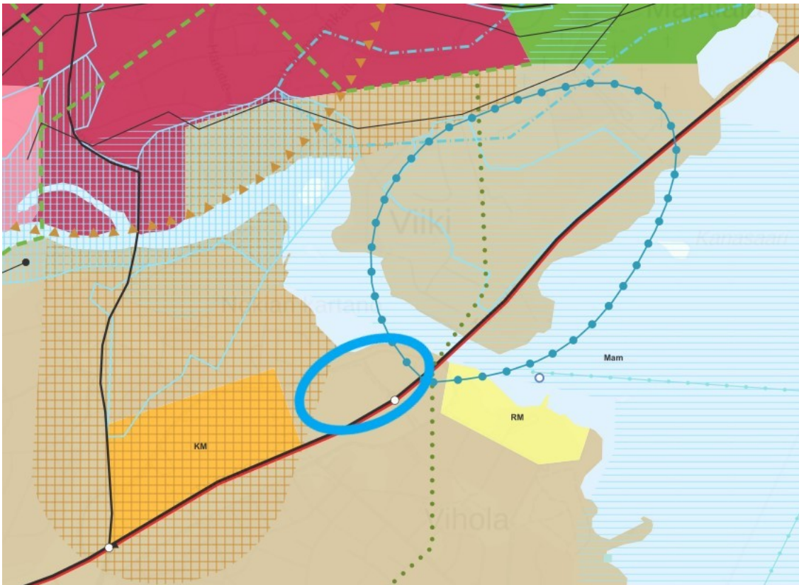
Kuva: Ote Pirkanmaan maakuntakaava 2040:stä.

Alueen luoteisosa on tiivistä joukkoliikennevyöhykettä. Merkinnällä osoitetaan yhdyskuntarakenteeltaan tiiviit, tiivistettävät tai tiiviinä toteutettavat alueet, jotka tukeutuvat tehokkaaseen joukkoliikennejärjestelmään.