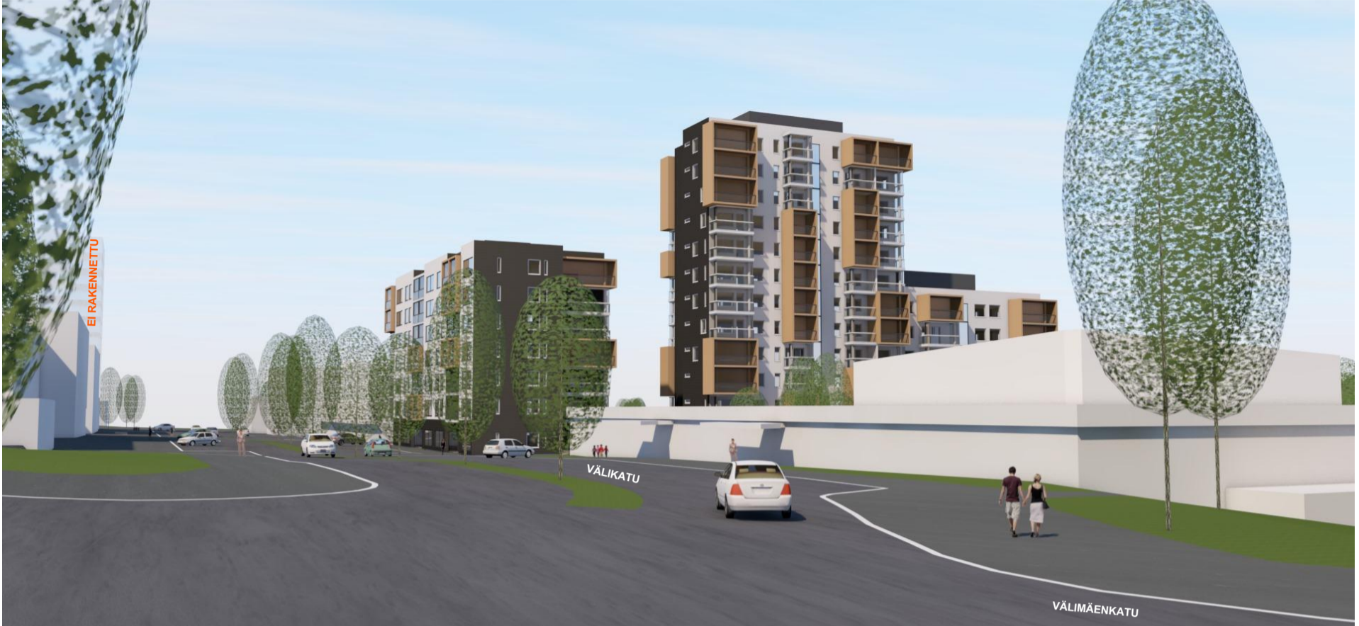
IDEALUONNOS IDÄSTÄ, VÄLIMÄENKADULTA