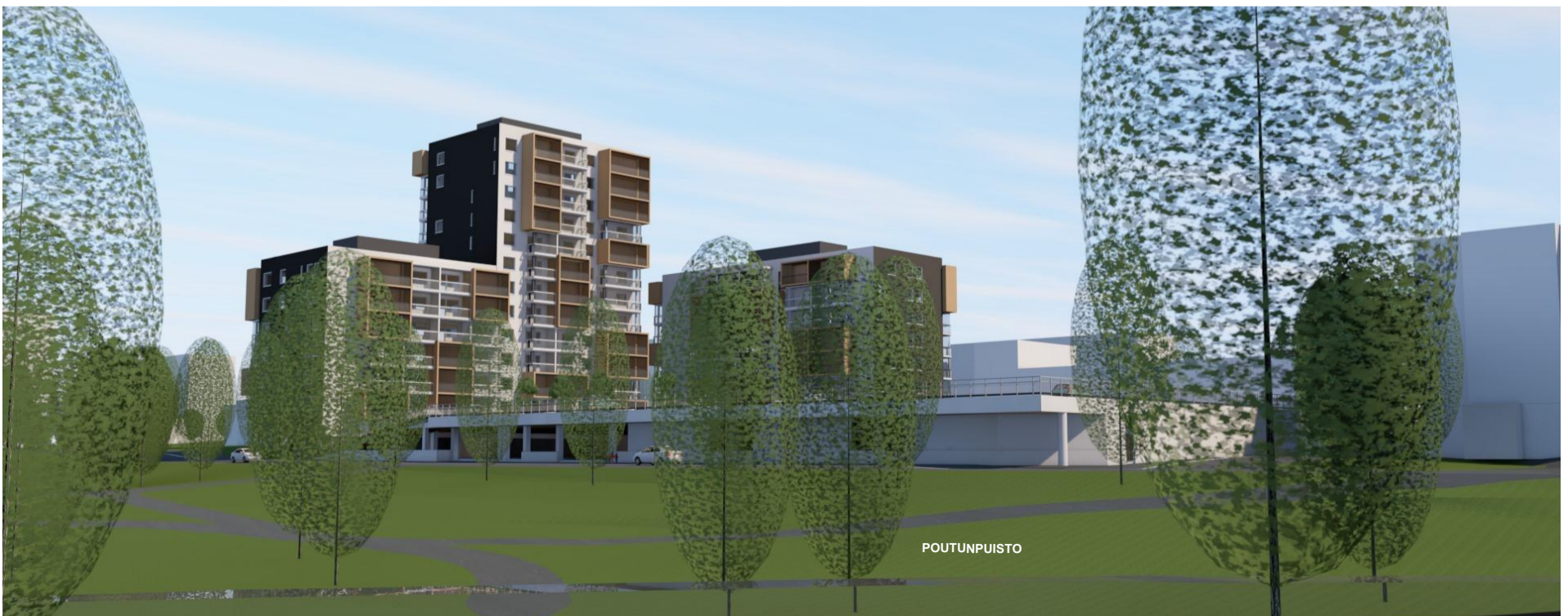
IDEALUONNOS KOILLISESTA, HÄRKITIELTÄ