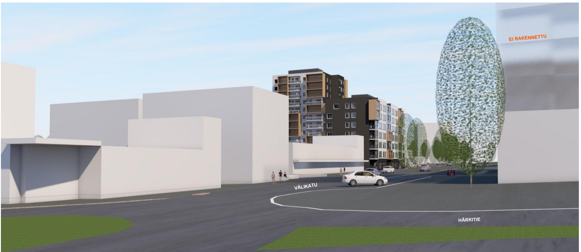
IDEALUONNOS LÄNNESTÄ, HÄRKITIELTÄ