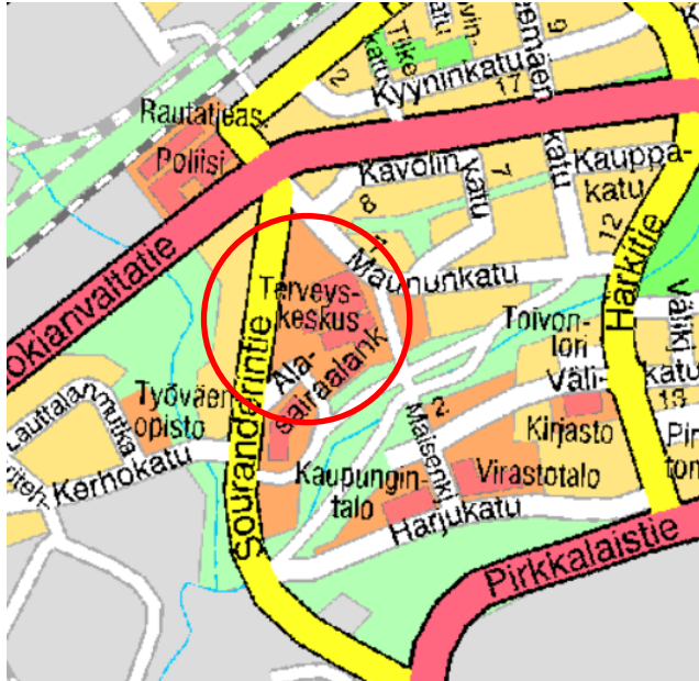
Asemakaava-alueen sijainti ja selvitysalueen alustava raja (punainen ympyrä). Kaavan rajausta tarkentuu kaavatyön aikana.